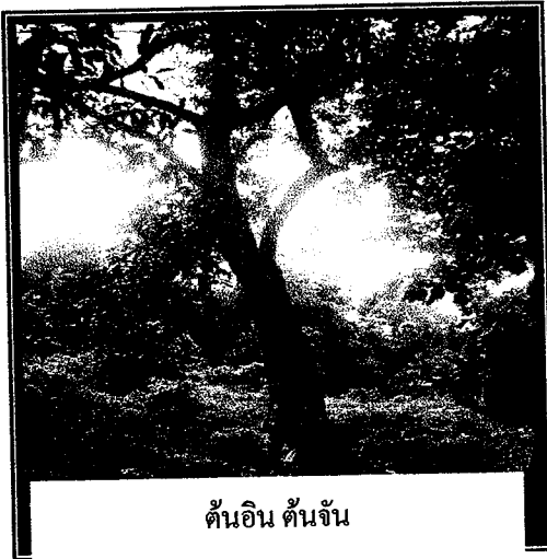
ต้นอิน ต้นจัน

บริเวณต้นอิน ต้นจัน มีลักษณะเป็นลานราบกว้าง กล่าวกันว่าเป็นลานไว้เล่นสกา ซึ่งเกมกีฬาที่พระองค์ท่าน ทรงโปรดปรานในขณะนั้น และลานที่ใช้สกาเป็นที่มาของ คำว่าลานสกาจวบจนปัจจุบัน