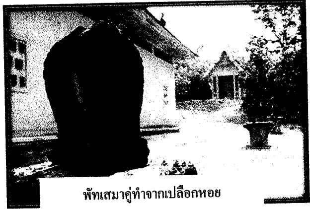
พัทธสีมาคู่ทำจากเปลือกหอย

นอกจากนี้บริเวณถ้ำเขาวัง หมู่ที่ ๒ มีการพบเศษถ้วยชาม มีร่องรอยของการลับมีดดาบ ลงบนหิน (หินลับมีดดาบ) และที่วัดลานสกา หมู่ที่ ๓ มีพัทธสีมาคู่ ที่ทำจากเปลือกหอย สันนิษฐานว่าเป็นเปลือกหอยที่พระเจ้าศรีธรรม โศกราช นำมาจากประเทศอินเดีย